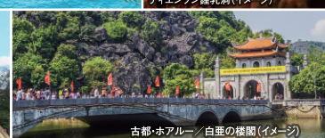
古都・ホアルー 白壁の楼閣 (イメージ)