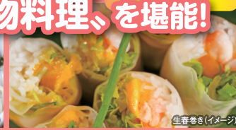
生春巻き (イメージ)