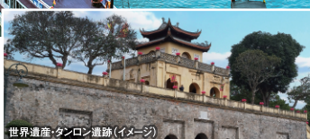
世界遺産・タンロン遺跡 (イメージ)