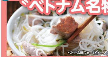
ベトナム麺フォー (イメージ)