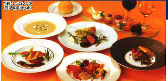
料理:シェガシワギ (鹿児島県出水市)