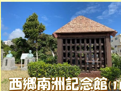
西郷南洲記念館(1日目)