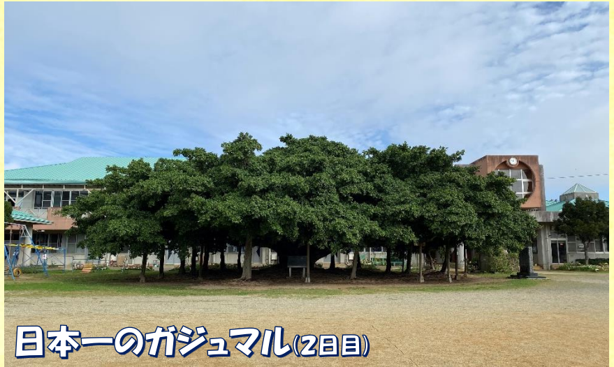
日本一のガジュマル(2日目)