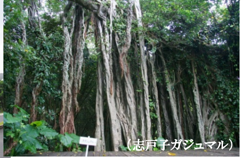
(志戸子ガジュマル)