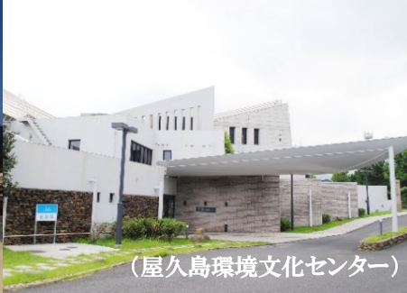
(屋久島環境文化センター)