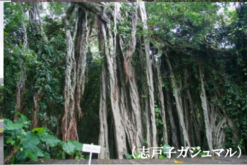
(志戸子ガジュマル)