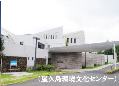
(屋久島環境文化センター)