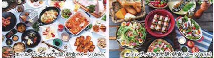
ホテルグランヴィア大阪/朝食イメージ(A55) ホテルヴィスキオ大阪/朝食イメージ(A55) ※朝食のご提供内容が変更になる場合がございます。