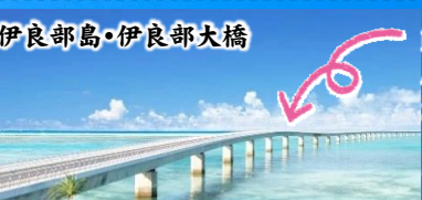
日本最長! まるで海の上を走る感覚!