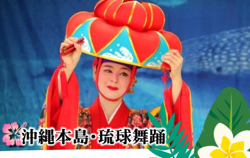
沖縄本島・琉球舞踊