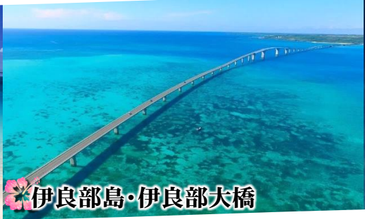
伊良部島・伊良部大橋