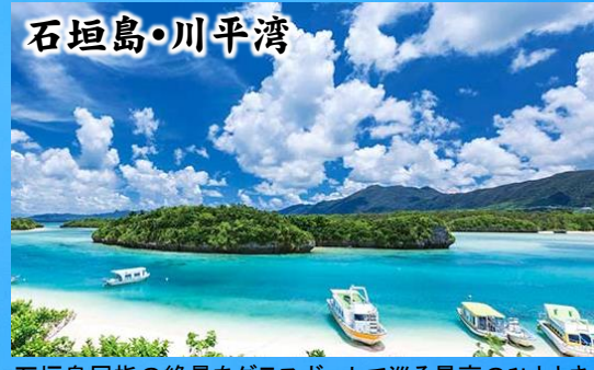
石垣島屈指の絶景をグラスボートで巡る最高のひととき!