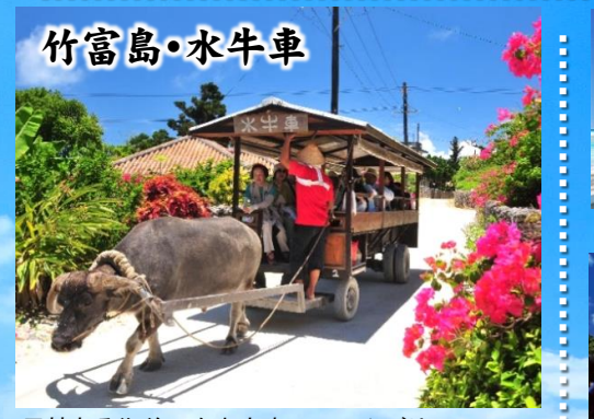
風情ある街並みを水牛車でのんびり!

憧れのデラックスホテルに泊まる 宮古・石垣・沖縄本島を巡る5日間の旅! 南国屈指の絶景や世界遺産など「これぞ南国」へご案内! 満席必至です!