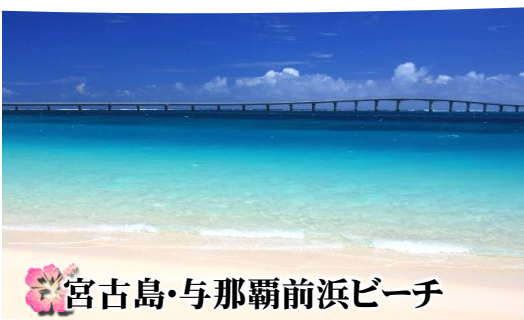
宮古島・与那覇前浜ビーチ