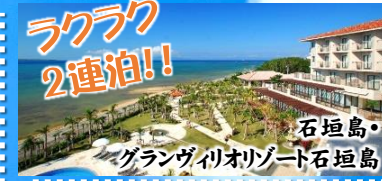
石垣島・グランヴィリオリゾート石垣島