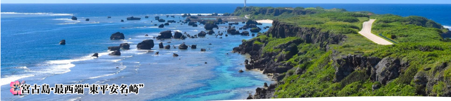
宮古島・最西端“東平安名崎”