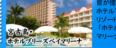
宮古島・ホテルブリーズベイマリーナ