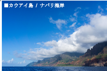
■カウアイ島 / ナパリ海岸