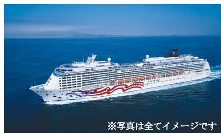
※写真は全てイメージです