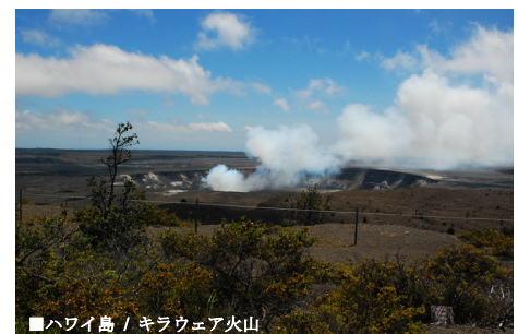
■ハワイ島 / キラウエア火山

このクルーズは、マウイ島とカウアイ島での停泊、オアフ島とハワイ島の寄港を盛り込んだ他には見られない航程です。流れる滝や活火山、黒、緑、白の砂浜、史跡、手つかずの自然を眺めながら、島ならではのゆったりとした時間をお過ごし下さい。