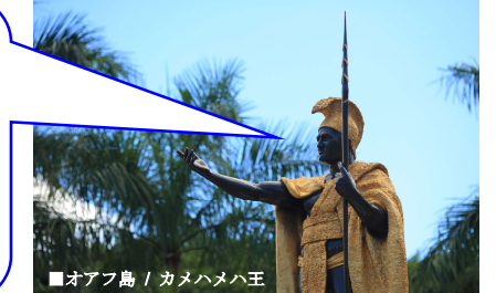
■オアフ島 / カメハメハ王

このクルーズは、マウイ島とカウアイ島での停泊、オアフ島とハワイ島の寄港を盛り込んだ他には見られない航程です。流れる滝や活火山、黒、緑、白の砂浜、史跡、手つかずの自然を眺めながら、島ならではのゆったりとした時間をお過ごし下さい。