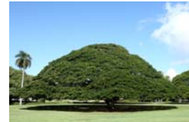
モアナアガーデン

表記時間は現地時間です。フライトスケジュールは交通機関の都合で変更になる場合があります。