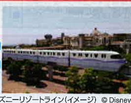
ディズニーリゾートライン(イメージ) © Disney

東京ディズニーリゾート内施設およびパーク内のアトラクションやエンターテイメント、その他施設が予告なく休止、または運営時間などが変更となる場合があります。つきましては、事前に東京ディズニーリゾート・オフィシャルウェブサイトでご確認ください。