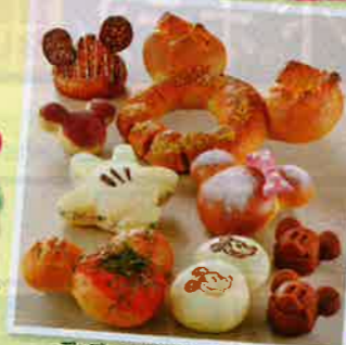
ディズニーアンバサダーホテル メニュー (イメージ)

ディズニーホテル内レストラン&ラウンジ利用券 滞在中お1人様1枚 1,000円分付き