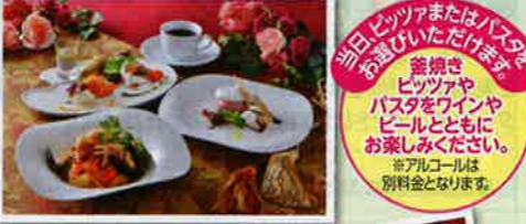
ランチコース/ピスタ(イメージ)