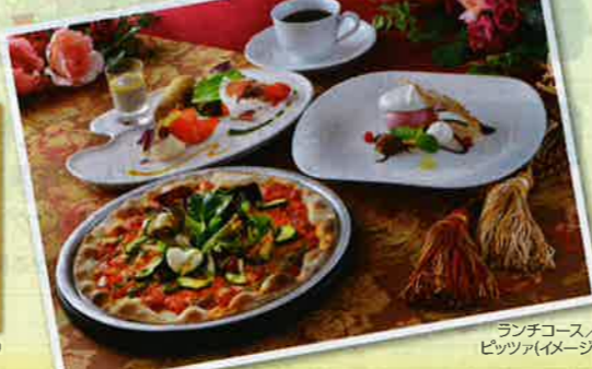
ランチコース/ピッツァ(イメージ)