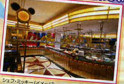
シェフ・ミッキー (イメージ)