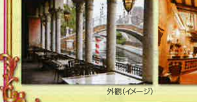
外観(イメージ) 店内(イメージ) お子様メニュー(イメージ) ランチコース/ピッツァ(イメージ)