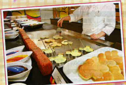
シェフ・ミッキーの朝食ブッフェ (イメージ)