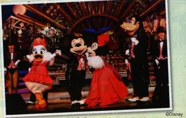
リニューアル! 東京ディズニーシーレビューショービッグバンドビート(イメージ)

◆場所◆東京ディズニーシー「ブロードウェイ・ミュージックシアター」 ご利用日に東京ディズニーシーに入園できるパークチケットが必要になります。