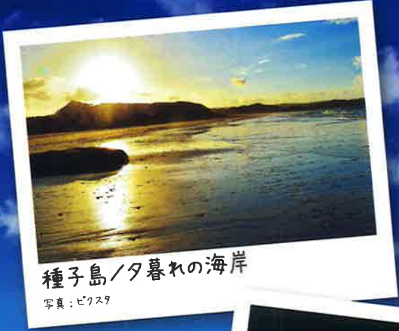
種子島/夕暮れの海岸