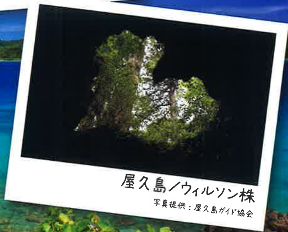
屋久島/ウィルソン株