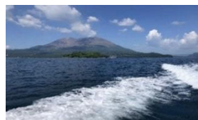
錦江湾クルージングしながら桜島へ