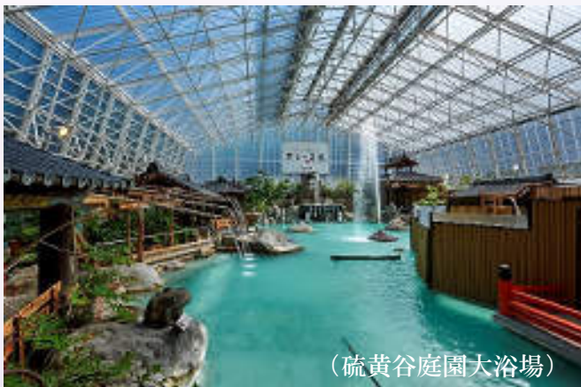
(硫黄谷庭園大浴場)