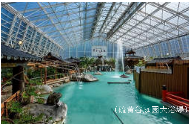
(硫黄谷庭園大浴場)

①この旅行は、鹿児島県の「今こそ鹿児島の旅事業」の支援対象です。 ②鹿児島県観光課の事業により、お一人様5,000円の助成を受けています。 ③本事業は、鹿児島県在住者が対象となっております。