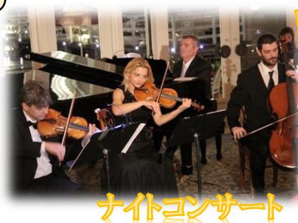
ナイトコンサート