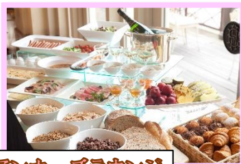
アンカースラウンジ