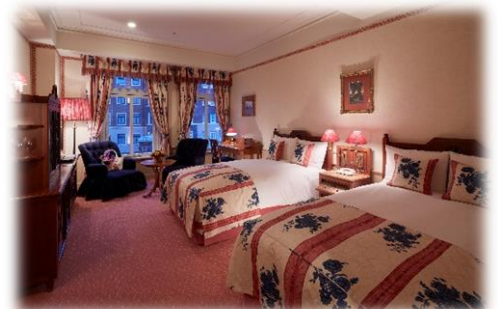
▲スタンダードツイン(例)